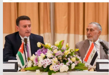
رئيس مجلس النواب الدكتور محمود المشهداني parliament_iq يجتمع بعدد من السفراء ورؤساء الهيئات الدبلوماسية في عمان

تقى رئيس مجلس النواب العراقي الدكتور محمود المشهداني برفقة نس. محلب النواب الأردني السيد أحمد الصفدي في العاصمة الأردنية