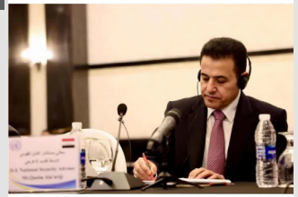
الأعرجي يترأس اجتماعاً لبحث عودة المواطنين العراقيين من شمال شرق سوريا

ترأس مستشار الأمن القومي السيد قاسم الأعرجي اليوم الأربعاء، اجتماعاً لمجاميع العمل التقنية العراقية والدولية المسؤولة عن تنفيذ اتفاقية الاطار العالمي لعودة المواطنين العراقيين من شمال شرق سوريا، بحضور نائب الممثل الأممي والمنسق المقيم للشؤون الإنسانية في