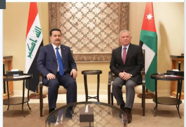
التقينا اليوم الأربعاء في العاصمة الأردنية الهاشمية جلالة الملك عبد الله الثاني بعمان، عاهل المملكة الأردنية الهاشمية جلالة الملك عبد الله الثاني

وبحثنا التطورات الراهنة في المنطقة، والأحداث على الساحة السورية. وأكدنا على أهمية تعزيز التنسيق الثنائي من أجل مواجهة التحديات الإقليمية والدولية، ومواصلة الجهود لمنع اتساع الصراع في الشرق الأوسط، مخط الخاتمة تحه الفهـ